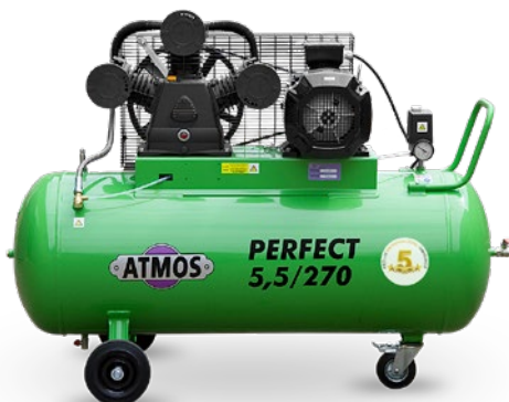
na zbiorniku poziomym