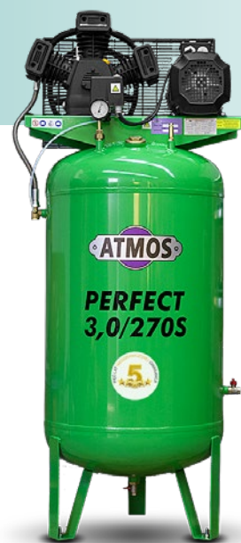
na zbiorniku pionowym